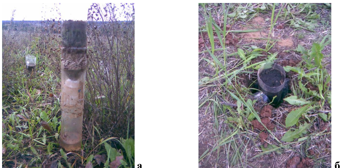
Рис. 2. а - вид устройства для полевых испытаний с загрязненной почвой; б - установка устройства в углубление в грунте.